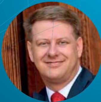
Tomáš Prouza prezident Svaz obchodu a cestovního ruchu ČR